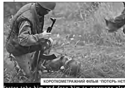
КОРТОКМЕТРАЖНИЙ ФІЛЬМ «ПОТЕРЬ НЕТ» faster take him and drag him to everyone else