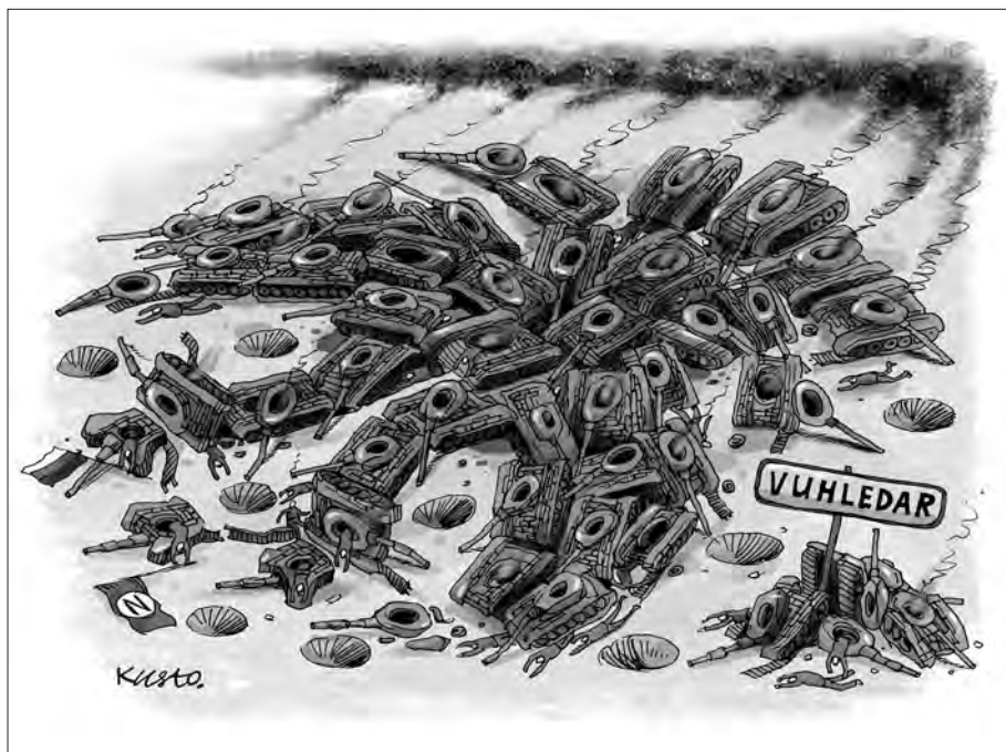
Танки російських окупантів під Вугледаром.